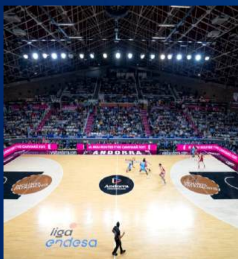
PAVELLÓ TONI MARTÍ