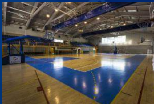
PAVELLÓ JOAN ALAY

En tot moment, les gimnastes estaran acompanyades i informades pels responsables de l'esdeveniment per garantir el compliment dels horaris i la seguretat.